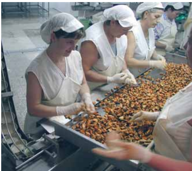
Traballando o mexillón

Así, é fundamental a cualificación material (esteá ou non reflectida no salario), a transmisión do coñecemento do medio mariño, o papel de coidadora do recurso e, polo tanto, de elemento clave na fixación da poboación, así como na perpetuación dunha relación histórico-cultural co mar. As bases sobre as que se sustenta a dinámica industrial da transformación do peixe en Galicia están en débeda co rol das mulleres no sector pesqueiro.