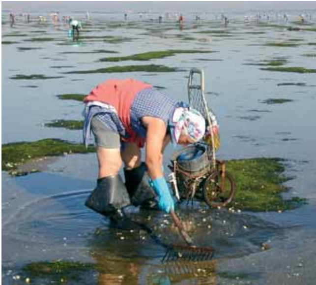
Mariscando no Serrido. Cambados

O problema do recoñecemento da forza laboral feminina na pesca galega non reside, por tanto, na mala identificación das actividades nas que participa, xa que existe cun papel económico fundamental para a obtención do produto pesqueiro, senón, máis ben, nas deficiencias das estatísticas oficiais para sacar á luz o traballo evidente das mulleres neste sector. Resulta, por tanto, moi difícil atopar unha cifra procedente de estatísticas oficiais que nos achegue ao número de mulleres activas galegas na pesca. Por poñer un exemplo, o desaparecido "Anuario de Pesca Marítima" (MAPA), ao considerar unha definición minimalista da actividade (captura a bordo dunha embarcación), non contemplaba a posibilidade da existencia de mulleres xa que non había mulleres tripulantes. Esta fonte estatística non foi substituída por ningún Anuario específico para o sector, polo que hoxe en día, agás as fontes censais (Censo de Poboación e Vivendas e Padrón Municipal de Habitantes), non se publica con periodicidade anual ningunha estatística que recolla a actividade pesqueira diferenciando entre ocupados/as e parados/as. Así, a estatística elaborada polo "Instituto Galego de Estatística" (IGE) para que sirva de apoio aos traballos das Contas Económicas de Galicia Macromagnitudes da pesca recolle, entre outras, información do persoal ocupado na pesca, no marisqueo a pé e na acuicultura sen diferenciar por sexos.