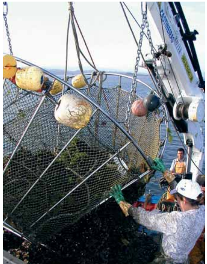
Traballadora nunha batea de mexillón

Entre todas as estatísticas chama particularmente a atención o informe da Comisión Europea El papel de las mujeres en el sector de la pesca (2002) pola súa deficiente recollida de información. Tendo en conta a importancia dun informe como este como instrumento para a toma de decisións na política comunitaria, esta infravaloración do emprego feminino pode levar á toma de decisións erróneas por parte da Unión Europea. Así, a sistemática inclusión de actividades como o marisqueo (case 7.000 empregos femininos e outros 1.000 masculinos) e a miticultura (case 2.000 empregos femininos e outros 5.000 masculinos) dentro da acuicultura mariña, pode levar a imputar o número de empregos existentes a actividades como a piscicultura mariña, altamente subvencionadas e cunha creación ínfima de empregos (apenas 200 no ano 2000, 52 dos cales corresponden a mulleres). Desta forma estase deixando de apoiar actividades que xeran un grande número de empregos femininos, coa conseguinte perda de benestar da poboación feminina autóctona, en beneficio das grandes multinacionais da piscicultura mariña.