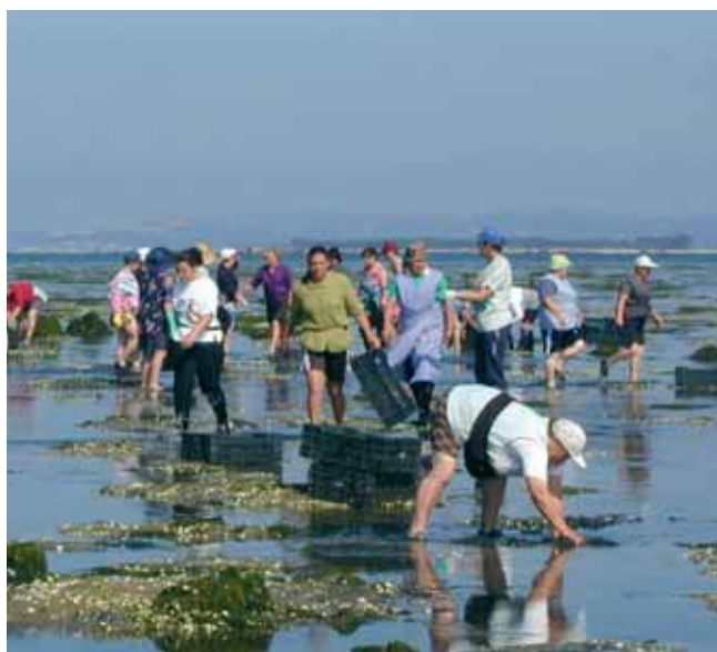
Mariscadoras na Ría da Arousa