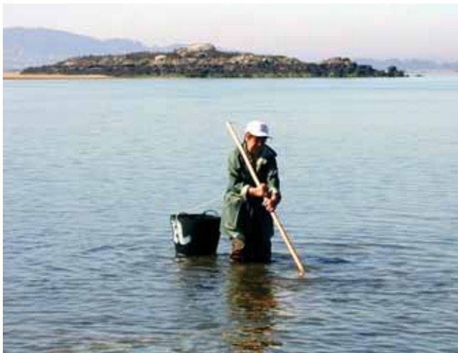
Mariscadora de Cambados

ascende ao 72,4% en A Coruña, ao 78% en Lugo e ao 94,7% en Pontevedra. Considerando os estratos de idade das mariscadoras nas tres provincias, a meirande parte delas teñen entre 46 e 65 anos (A Coruña o 58%, Lugo o 71,4% e Pontevedra o 69,1%). Por tipoloxía de permex (permiso de explotación concedido pola Consellería de Pesca e Asuntos Marítimos que actúa como título habilitante para exercer a actividade marisqueira), 4.138 destas mulleres posúen permisos de explotación xeral mentres que as restantes 218 dirixen a súa actividade produtiva ao percebe. Comparando os anos 1996 e 2005, a provincia de Pontevedra é a que acolle o maior número de mariscadoras, que oscila no 60% do total. Non obstante é a provincia de Lugo a que, en termos porcentuais, rexistra o