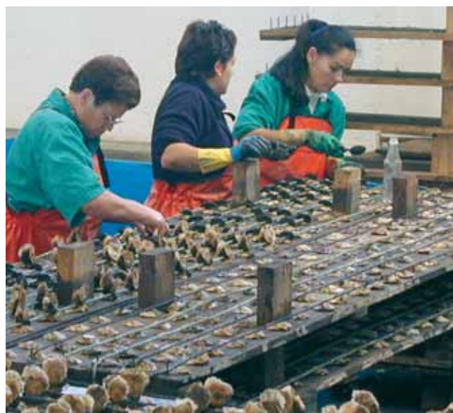
Encordando a ostra