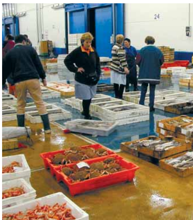
Regateiras na lonxa

En función da porcentaxe de emprego feminino, podemos distinguir subsectores cun nivel baixo de participación das mulleres, integrado por Gran Altura, Altura, Litoral e Baixura, que en ningún caso supera o 10% de emprego feminino; cun nivel de participación medio, integrado pola miticultura, onde a participación das mulleres supera a cuarta parte do emprego total; e, finalmente, cun nivel de participación alto, os subsectores da conserva e do marisqueo a pé, nos que acadan cifras arredor do 80% do total. Hai que salientar que os tres subsectores nos que a presenza das mulleres é maioritaria ou de relevancia decisiva (marisqueo, miticultura e conservas) non existirían como se coñecen hoxe en día de non contar coa forza laboral feminina.