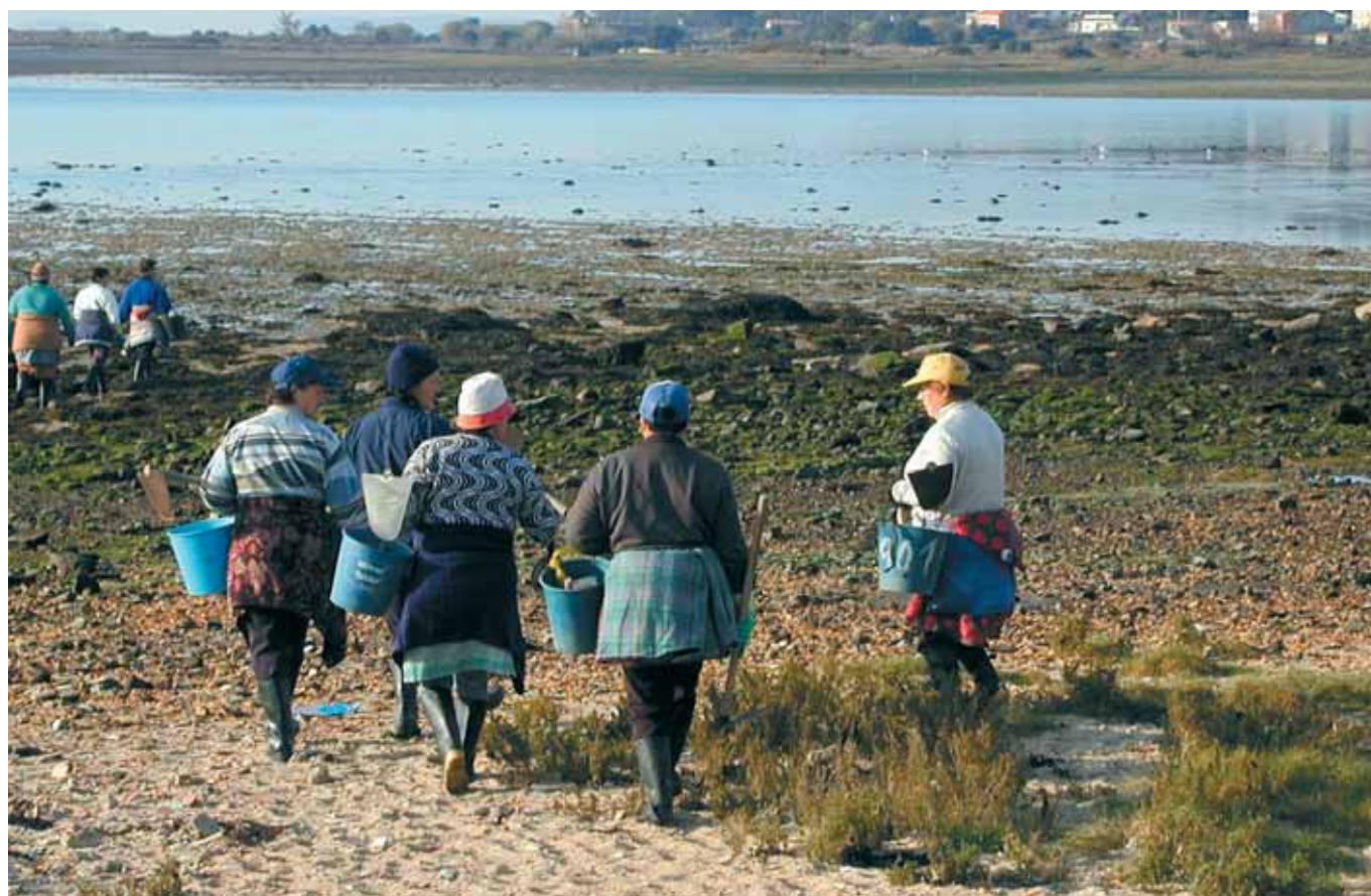
Camiño da seca