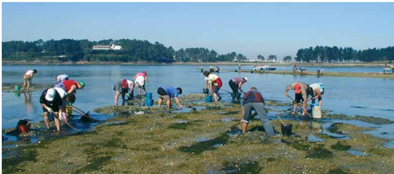
Mariscando en Castrelo (Cambados)

Aínda que a porcentaxe de emprego feminino total no sector pesqueiro galego nas TIOPesca 99 é algo inferior ao da publicación da Comisión Europea (2002), a diferenza no número de empregos en valor absoluto é moi importante, resultando que as cifras da primeira fonte duplican os achegados pola Comisión. Coas demais fontes analizadas, sacando a elaborada pola Consellería de Pesca, só é posible realizar unha comparación para o sector pesqueiro (pesca extractiva, marisqueo e acuicultura) dado que non achegan datos para a industria de transformados, comercio, etc. Como se pode apreciar na Táboa 2, os empregos sitúanse entre 30.000 e 40.000, sendo superados