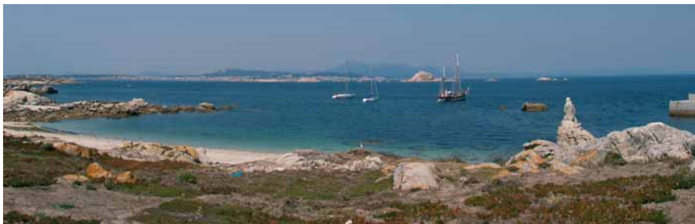
Praia de Sálvora.

Os náufragos chegaban a terra desfalecidos e houbo algún que morreu polo camiño debido á hipotermia, cando xa estaba nas mans salvadoras das mulleres. Os máis afortunados foron atendidos e levados a unha caseta preto do peirao, onde