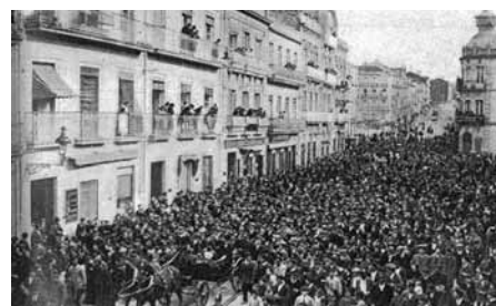
Homenaxe nas rúas de Vigo ás "Heroínas de Sálvora".

As heroínas de Sálvora foron convidadas a participar en numeros homenaxes populares en diversos puntos da nosa xeografía como Vigo, A Coruña, Vilagarcía, etc. Lamentablemente, sobre elas formouse en certos medios unha lenda negra que as acusaba de roubar nos cadáveres do naufraxio, cuestión esta totalmente falsa coa que se tentou desprestixiar os seus actos de heroísmo.