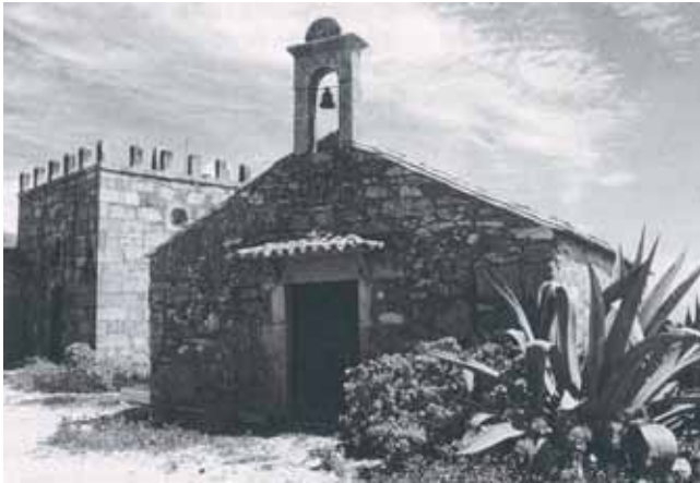
Antiga taberna da illa de Sálvora, reconvertida en ermida

Ademais dos caseiros, nesa altura vivían en Sálvora cinco persoas máis, integrantes das familias dos torreiros encargados daquela de velar polo mantemento do vello faro de Sálvora e mais de atender as obras que se estaban facendo para a construción dun novo faro, que sería inaugurado a finais dese mesmo ano de 1921. Os torreiros funcionaban a xeito de intelectualidade, xa que polas noites eran eles os encargados de poñer escola á rapazada da illa.