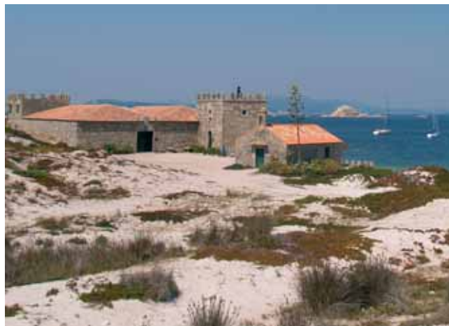
Capela e Pazo de Sálvora.

data a propiedade da illa fora privada, tendo que pagar a metade da produción anual en concepto de foro. Os habitantes da illa non pasaban fame e cultivaban millo, centeo, fabas, etc. Había gando de todo tipo. Sirva como exemplo que en cada casa había cinco ou seis vacas. Na illa había tamén dous hórreos, que se quedaban pequenos en anos de boas colleitas, e mesmo un pombal. Todo iso sen contar coa riqueza mariña das súas costas, que se dá por feito, abundantes en sardiña, luras, mariscos de todo tipo, etc., que se pescaban coa dorna que tiña cada familia. O centro da vida social na illa era unha taberna situada preto do peirao, mais a vida non era nada cómoda en Sálvora e carecíase, por exemplo, de electricidade ou de calquera tipo de comunicación por radio co continente.