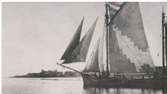
Galeóns fronte á Toxa