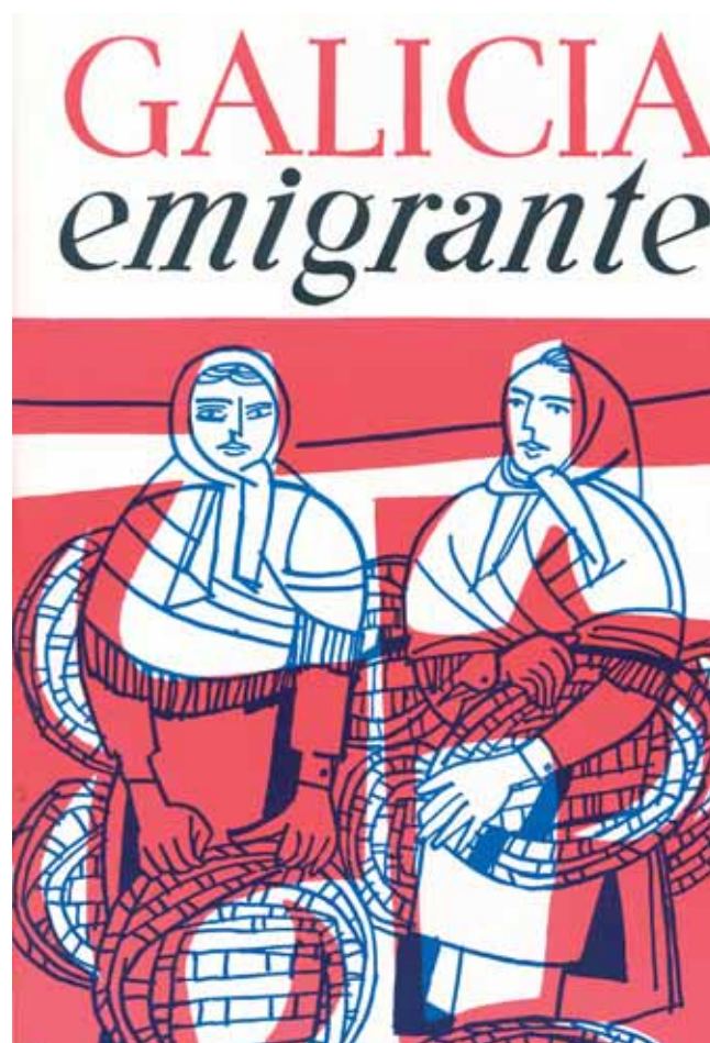
Portada de "Galicia Emigrante", nº 33, debida a Luís Seoane

da condición. Ramón, el si comprometido de por vida coa Humanidade doente, afirmou naquelas páxinas de Galicia Emigrante que o traballo escravo non impedía a fermosura, unha fermosura que non entendía de mans brancas, pel coidada ou talle de avespa propias do ideal feminino imposto polas capas acomodadas e ociosas; pero tamén deixou escrito que a beleza e a sensualidade daquelas princesas das barreiras tampouco escondía a infame e secular explotación da que eran obxecto.