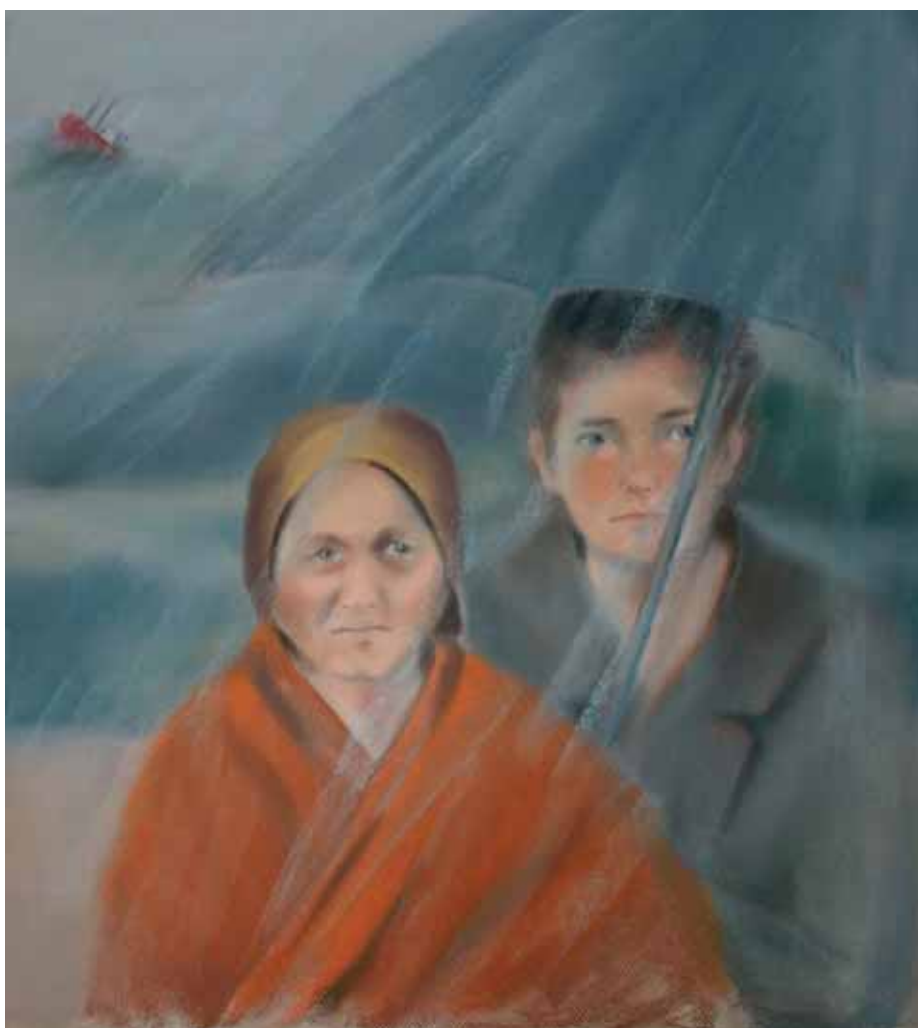
"Muller e neno" ('Chove e solo o quedo se move'. Uxío Novoneira), óleo sobre táboa, 1'10m.x 70 cm.