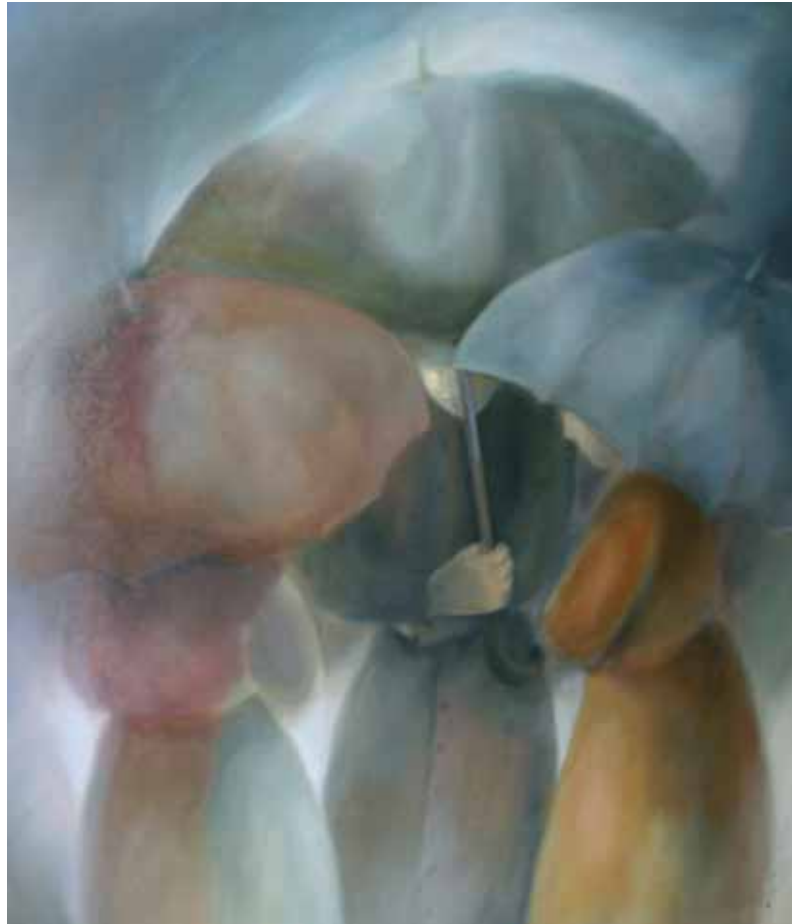
"Agardando", óleo sobre táboa, 1'50x 1'27 m.

Acuarela pertencente a: Coñece Celeiro, porto punteiro (2000), editado polo Seminario de Estudos Terra de Viveiro e Puerto de Celeiro S.A.