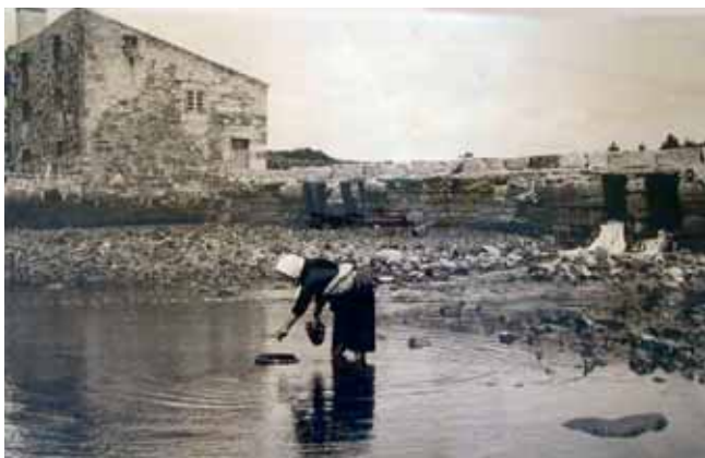
Muller traballando nas inmediacións do Muíño da Seca (Cambados)

Sabela vai na vela e Ramón vai no timón; Lourenciño, o pequeniño, vai tocando o acordeón.