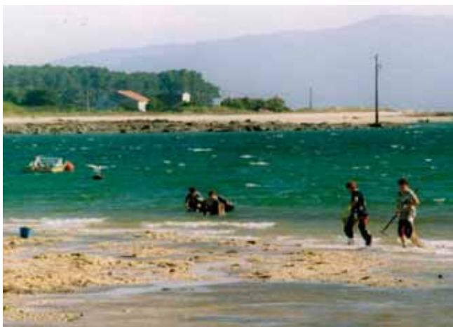
Mulleres mariscando na Illa da Arousa.

As peculiares condicións da vida da beiramar –peixes e mariscos que se reproducen de seu e son todos comestibles- permiten asegurar a mantenza dispoñendo das ferramentas axeitadas e da forza de traballo que as manexe; por iso, a muller, en tendo un home responsable, pode deixar nos seus brazos a responsabilidade do sustento económico da casa: