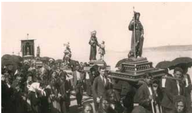
Procesión da Virxe da Barca. Muxía. 1929.

Nosa señora da Barca alá vai pola ribeira con zoquiños e mantelo ¡parece unha rianxeira!