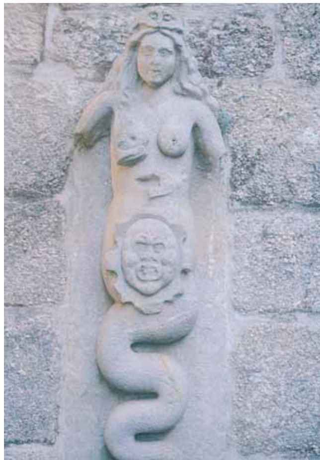
Serea. Pazo da Picoña. Salceda de Caselas.

Se ti quixeras oír os meus mellores cantares, non saberías se era eu ou a serea dos mares.