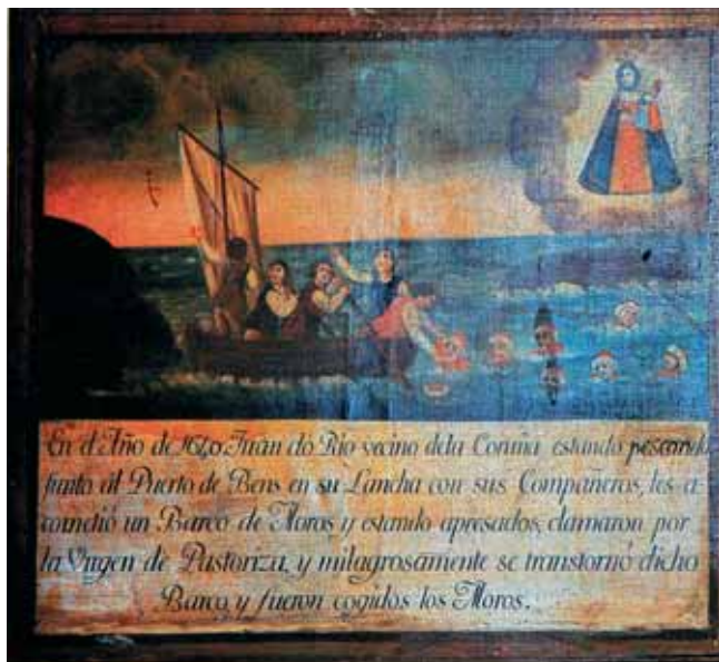
Exvoto mariñeiro no santuario da Pastoriza (Arteixo)

Nosa señora de Bares que nos dea o vento en popa, que somos os de Celeiro e temos a vela rota.