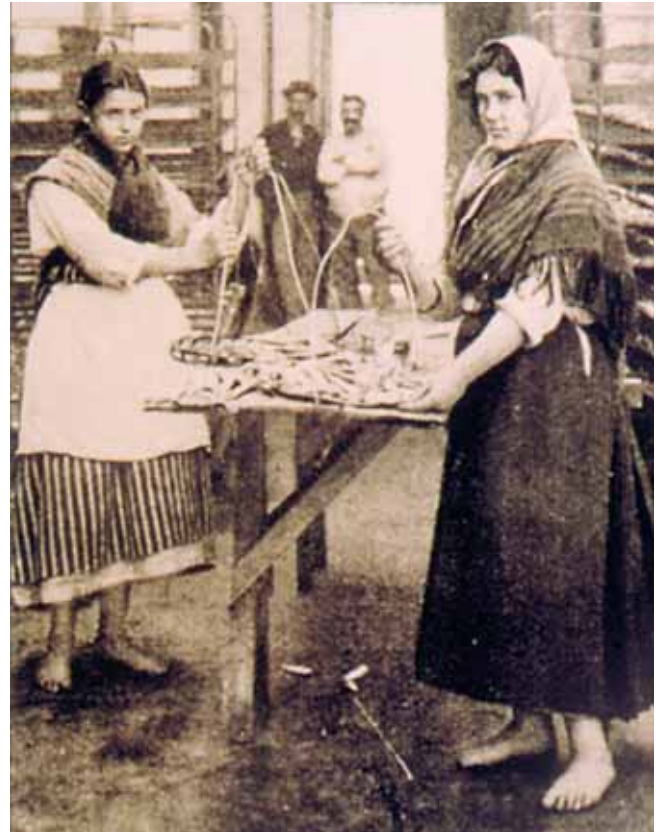
Traballadoras dunha conserveira. Vigo, comezos do s. XX

A muller real, aquela que vive, goza, traballa e morre na ribeira aparece nas cantigas en moitas desas situacións: namoradeira, namorada, emparellada, traballadora, etc. Nesta última centrase agora a nosa atención: