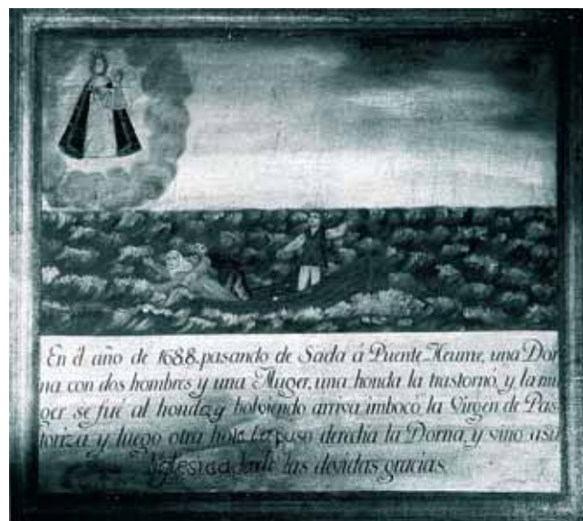
Exvoto mariñeiro no santuario da Pastoriza (Arteixo)

A protección dada por estas santas e virxes non se limita só ós mariñeiros, senón, en xeral, ás viaxes por mar. Iso é o que explica que os emigrantes se dirixan a elas para que os protexan na súa travesía: