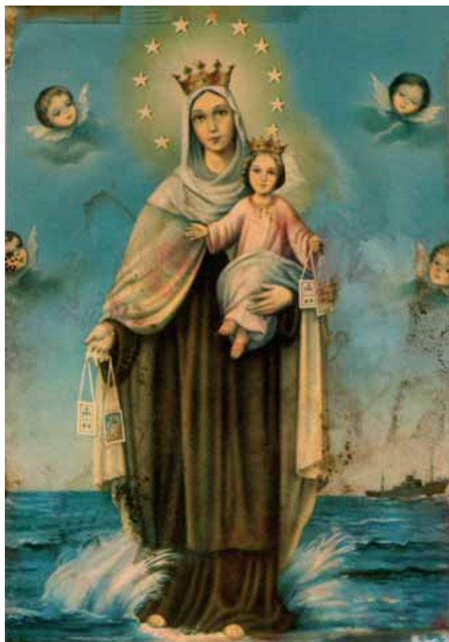
Imaxe da Virxe do Carme