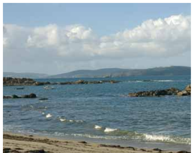
Porto de Quilmas