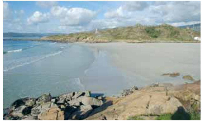
Porto do Pindo

Empezouse a correr que as subidas ó monte tiñan resultas, e que a María quedara preñada, e botábanse a ollo cálculos se estaría de catro meses ou de cinco, porque nin os que foran amigos dela e do home se atrevían agora a preguntarlle directamente. Mais non houbo moito tempo para especulacions. A María estivo dous días sen saír da casa, metida na cama para que as nenas non puidesen dicir nada, e cando saíu tiña a cintura tan delgada como adoitaba.