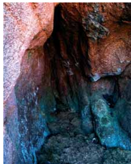
Unha das covas que no Pindo serviron de agocho aos "fuxidos" do 36