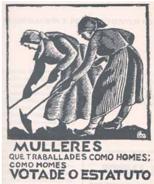
Cartaz de propaganda para o plebiscito estatutario de Xuño de 1936.

coellos polos penedos do Pindo, e gastaba aló moitas horas, quizabes non tan proveitosas, pero si máis gustosas cás da pesca, oficio que practicaba máis por necesidade ca por vocación.