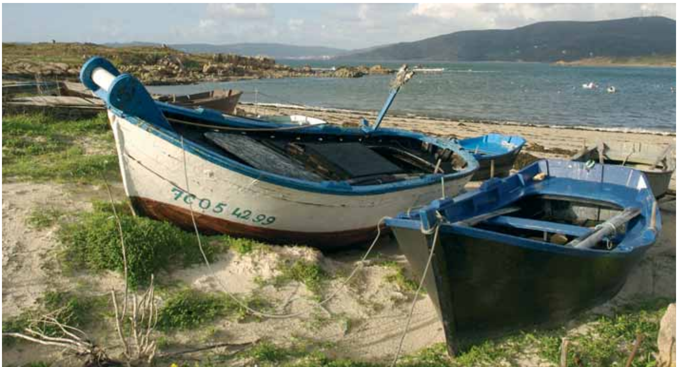
Porto de Quilmas

E a mariñeira de Quilmas seguiu indo ó mar con bastante fortuna. A filla máis vella empezou a encargarse de levar o peixe a vender, e o traballo, sendo aínda moito, facíase máis levadeiro. As viaxadas ó monte, os oportunos avultamentos de