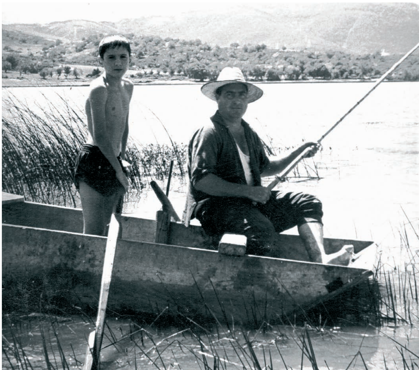
Pescador e neno nunha típica barca do lago de Carucedo