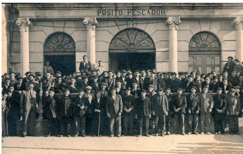
Pósito de Cambados, anos 30

Eis a singradura que quereríamos deixar anotada no libro de a bordo do "Barco da Memoria".