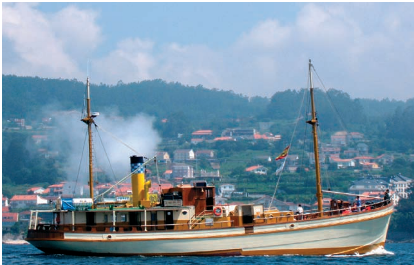
O Buque "Hidria Segundo" - O barco da memoria