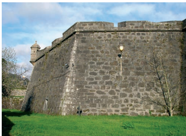
Muralla do Castelo de San Felipe, nos arrabaldos de Ferrol; alí se fusilou a moitos antifranquistas

Nas Rías do Norte, a represión estivo vencellada en moitas ocasións ás fugas argalladas por antigos afiliados aos sindicatos mariñeiros, que actuaron na clandestinidade a partir do verán de 1936. Tal aconteceu en Cariño, onde tras a saída dunha vintena de membros do "Sindicato de Industria Pesquera" (CNT) no bonito "Arkale", os falanxistas vingáronse fusilando contra os muros do ferrolán Castelo de San Felipe a 11 homes da vila, correndo o mes de setembro daquel mal