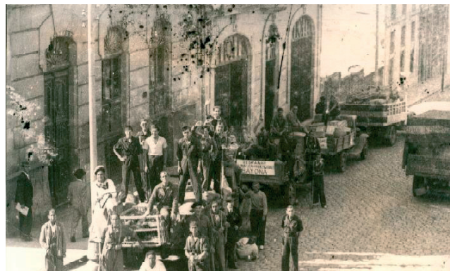
Falanxistas de Baiona, autores da matanza da Volta dos Nove, en Vigo nos primeiros días tras o golpe militar

Ademais, nas Rías Baixas o mar foi tamén foxa común: en Cangas, Moaña, Bueu ou Vilagarcía, barcos de pesca alugados para a ocasión a fabricantes e arma-