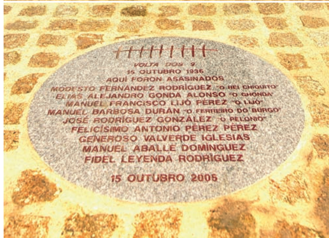
Monumento en homenaxe aos asasinados na Volta dos Nove, promovido polo Instituto de Estudos Miñoranos e realizado de balde por Fernando Casás.

veciñanza ata os anos 50 ou 60 do século pasado, pois durante todo este tempo aparecerían día a día nove cruces gravadas na terra, na curva onde caeran os corpos sen vida.