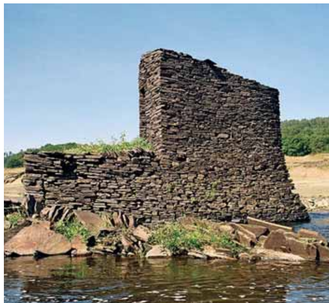
Caneiro da comarca lucense de Portomarín (Lois Ladra)

E así poderíamos seguir a citar unha mancha de exemplos, referindo o uso de cortiza de sobreira ( Quercus suber ) para a elaboración de boureis, o recurso a candullos e