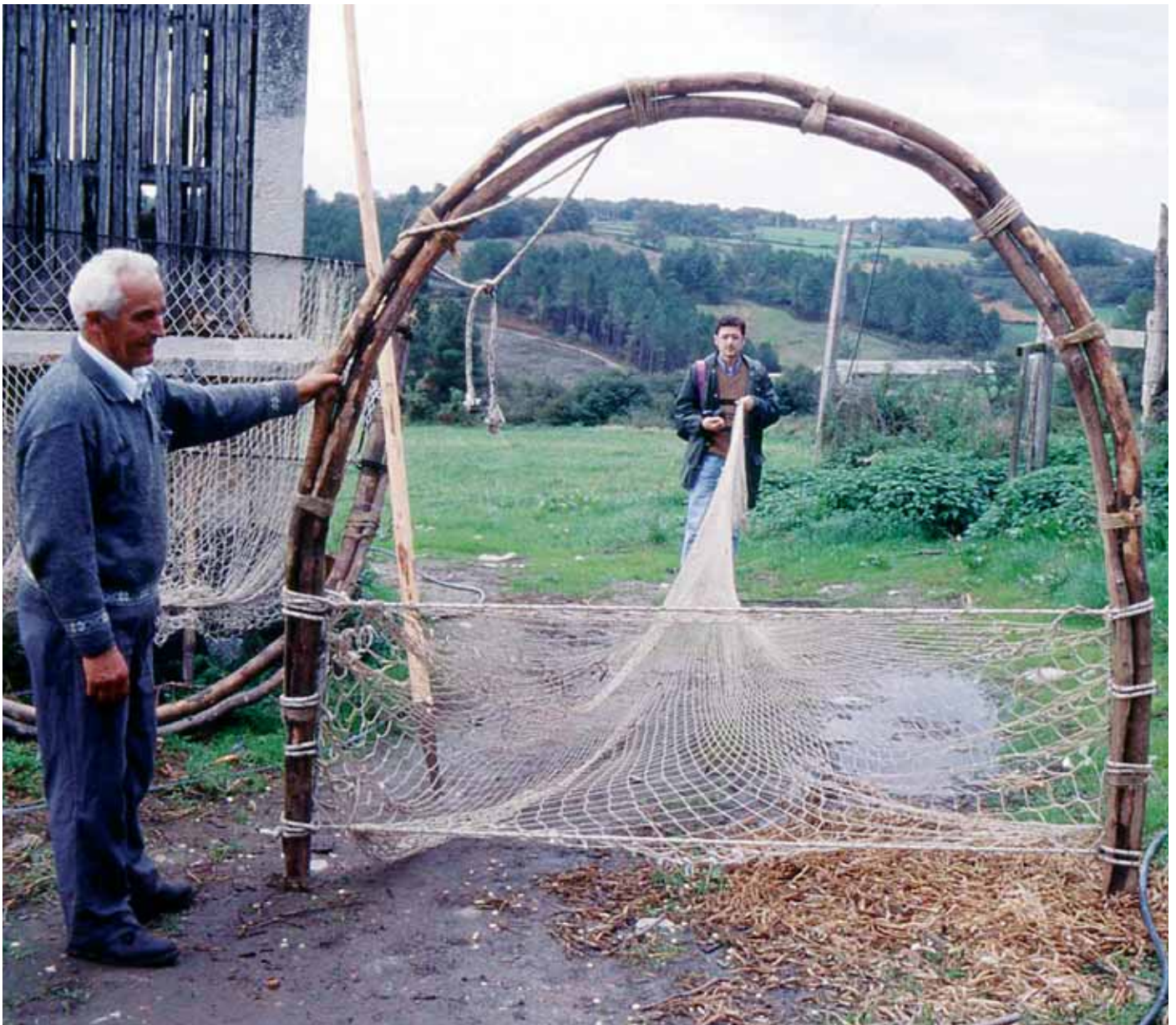
Dous homes sosteñen un caneiro e a súa rede na zona de Portomarín

do coñecemento do medio e das materias primas naturais que este é capaz de fornecer levaron ao desenvolvemento dunha tecnoloxía pesqueira artesanal e respectuosa coa Natureza, documentada ao longo dos últimos dous mil anos. Porén, esta cultura material atópase actualmente nun proceso de forte crise identitaria que, de non ser atallada a tempo, provocará irremediabelmente a desaparición total das artes da pesca fluvial artesanal no prazo dunha ou dúas xeracións. Cómpre tomar medidas urxentes e proceder ao seu inventariado e recolla selectiva, antes de que sexa demasiado tarde e de que só as poidamos contemplar fóra do seu contexto orixinal, inmóbeis e inermes, no interior das frías vitrinas ou nos almacéns dos museos.