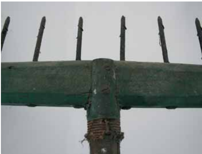
Detalle dunha fisga, empregada na pesca a xeito de arpón

individual e marcadamente estacional, sendo frecuente a formación de grupos de pescantíns que acudían ao río cos seus aparellos para a captura ocasional de certos peixes migratorios, tal e como aínda se fai coa lamprea no val do río Tea.