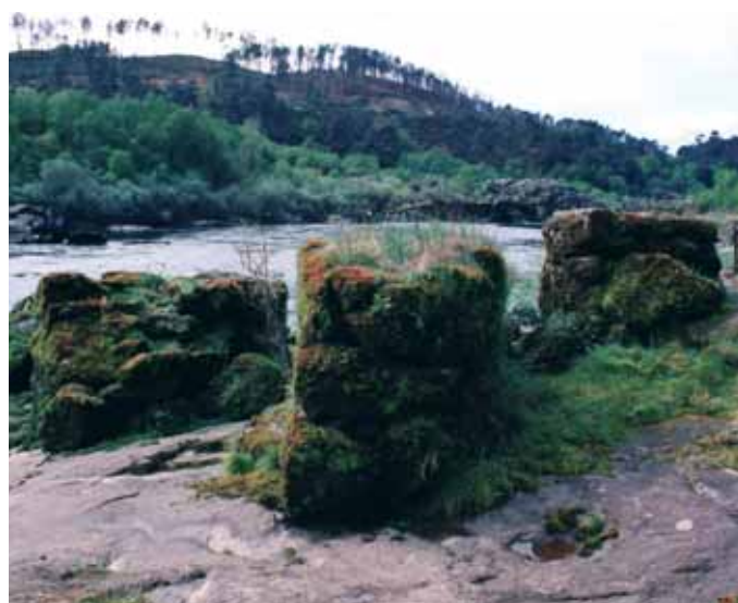
Pesqueira da comarca pontevedresa de Arbo (Lois Ladra)

Actualmente xa resulta moi difícil atopar artes e aparellos elaborados en materiais naturais. O máis frecuente é constatar a case que total substitución do binomio madeira-fibras vexetais pola tríada metal-plástico-fibras sintéticas. Este proceso témolo observado directamente en artes coma os vituróns no Baixo Miño, as cangallas no Baixo Ulla, os arcos en Portomarín e os diversos panos das redes en case