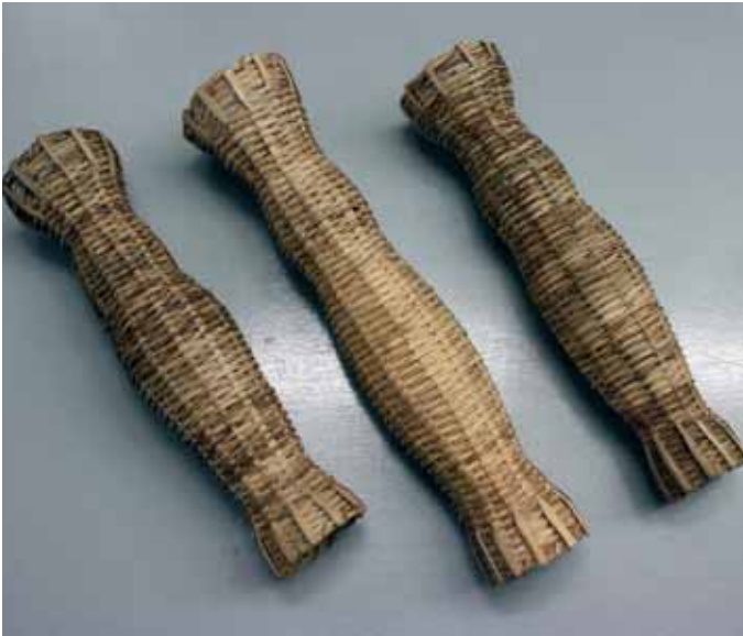
Nasas empregadas para a pesca da anguía

Pódese dicir sen temor a equivocación que a inmensa maioría dos ríos galegos foron sometidos tradicionalmente a un aproveitamento ecolóxico e racional da súa riqueza piscícola, sempre en función de diversos paráme-