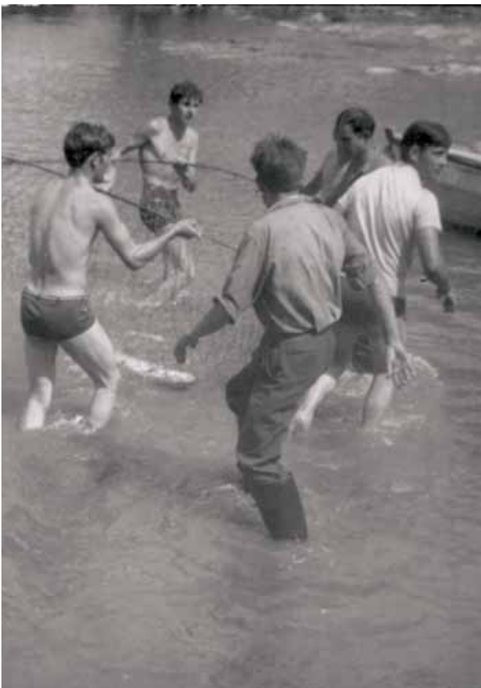
Pesca tradicional con rede no río Avia.

Pódese dicir sen temor a equivocación que a inmensa maioría dos ríos galegos foron sometidos tradicionalmente a un aproveitamento ecolóxico e racional da súa riqueza piscícola, sempre en función de diversos paráme-