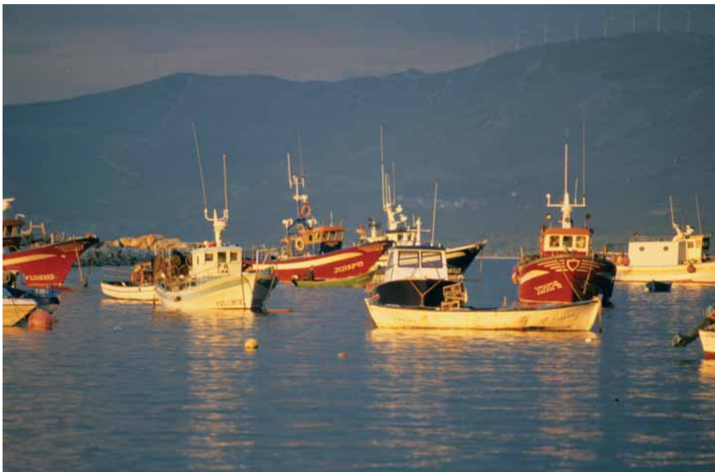
Porto de Muros

Muros que nunca deixou de ser mar, que viste de sal as galerías brancas, que contempla o transcórrexer dos días dende as fiestras góticas, que canta ao son das fontes, que se viste de muradana cando cae a tarde.