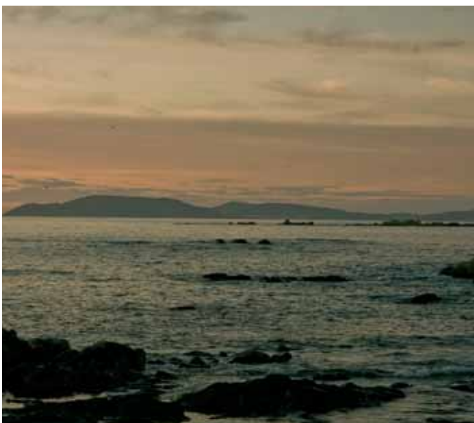
Vista da liña de costa desde Lira

Foron estes portos e abrigos de xeiteiras. Sobre oitocentos barcos deste tipo estimaba Artaza que había na ría nos últimos anos do século XIX, traballando arreo para as fábricas dos cataláns que se instalaron aquí acolléndose ao proclamado beneficio da revolución industrial. Sería por iso que, cando os membros da Asociación Cultural Canle de Lira decidiron construír unha embarcación tradicional, optaron por unha xeiteira que encargaron nos estaleiros Triñanes, na parroquia de Cabo de Cruz, e o primeiro mastro fóronllo adquirir a un crebeiro con almacén propio nun lugar recollido da Costa da Morte. Esta asociación e máis a de Mar de Muros recibiron a encarga de organizar os IX Encontros de embarcacións tradicionais de Galicia deste ano 2009.