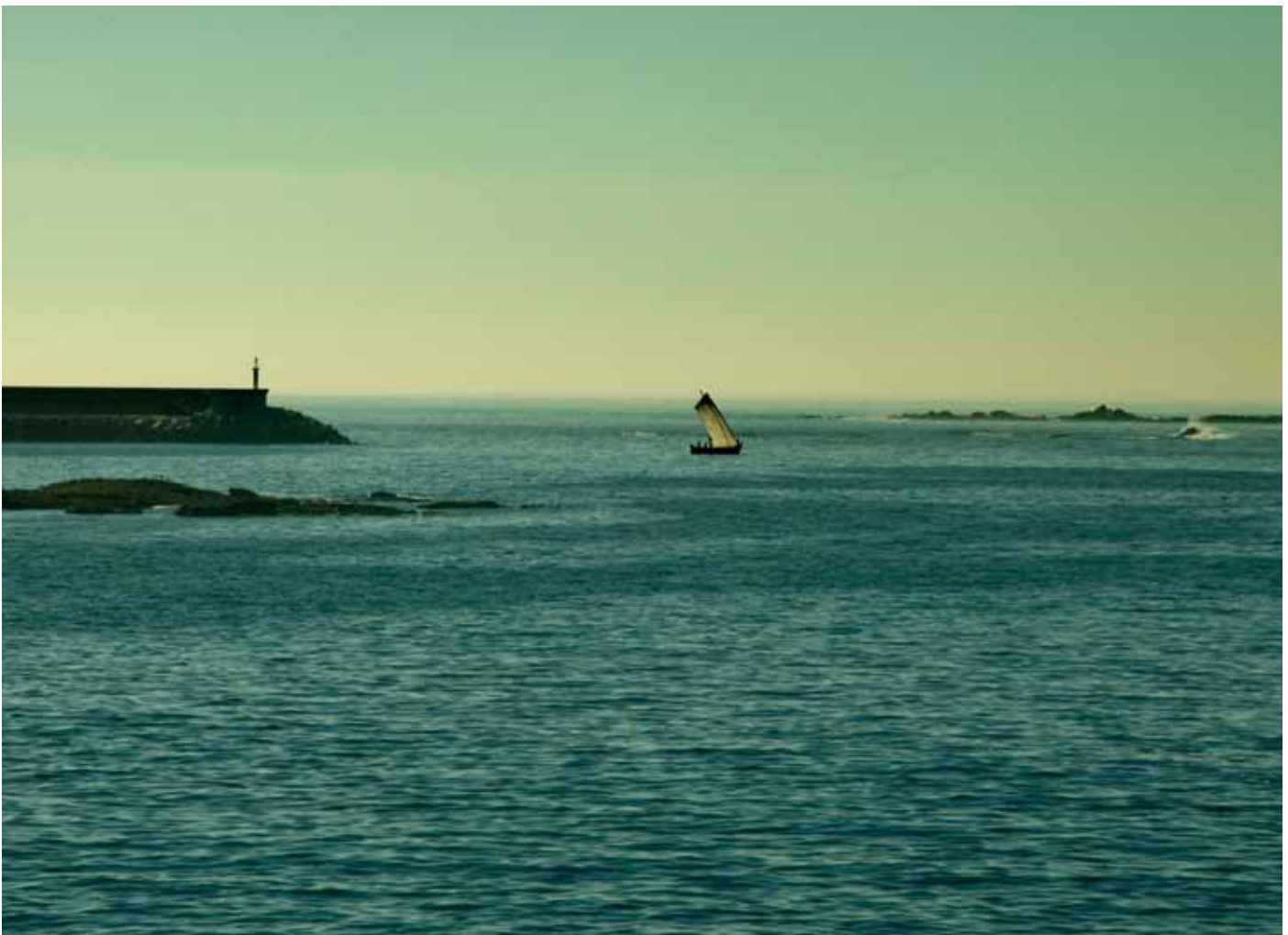
A xeiteira A Canle navegando

humanidade e hospitalidade son conceptos que non só figuran nos escudos dos concellos, senón que a xente sente coma propios, parte esencial dun xeito de ser, aquí, neste mar e neste territorio con carácter.