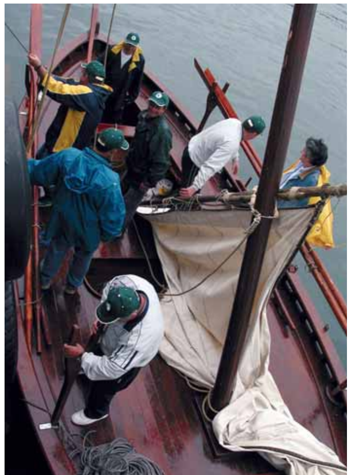
Preparativos para saír ao mar na xeiteira A Canle