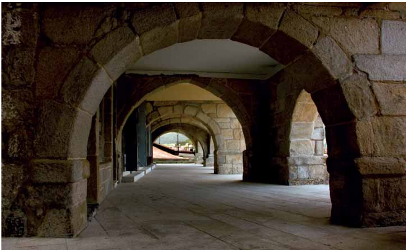
Esta fotografía de Maribel Longueira serviu de base para a elaboración do cartel do IX Encontro de Embarcacións Tradicionais