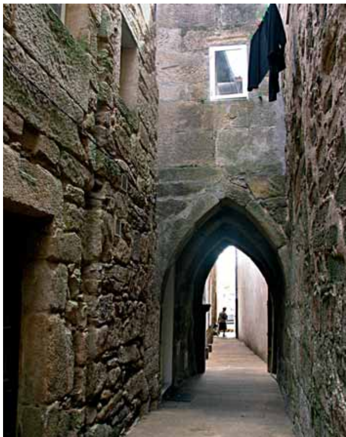
As rúas do casco antigo muradán conservan aínda vestixios góticos

Os pasaxeiros que viaxaban no “carreto”, o vapor de carga e pasaxe que cubría a ruta Noia-Muros, ao pasar a rentes da illa saudaban cun “Salve a Virxe!”. A xente de Lira aínda recita os versos que fan referencia a outra Virxe, a súa, a dos Remedios, aquela que non quixo ir a Sevilla porque