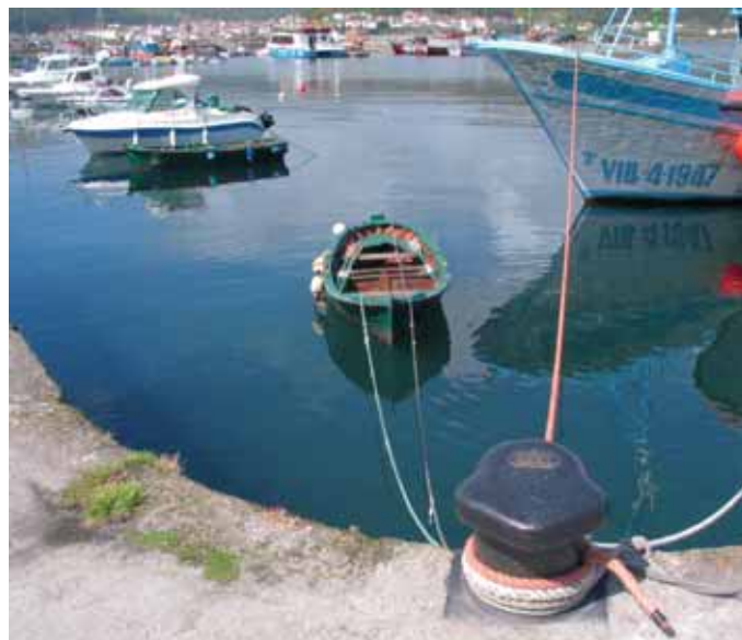
Distintos tipos de embarcacións amarran no peirao muradán

Logo sería a dársena que neste mes de xullo acollerá galeóns, dornas, gamelas, botes, buquetas, racús e traíñas, embarcacións que participarán no encontro. Esa dársena vella forma parte fundamental da fachada marítima dese