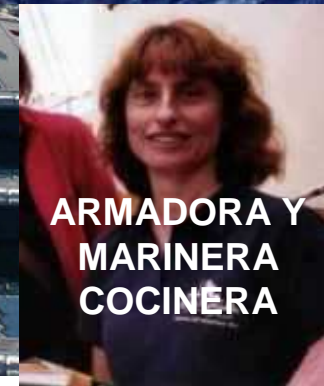
ARMADORA Y MARINERA COCINERA