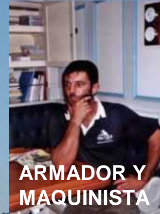
ARMADOR Y MAQUINISTA