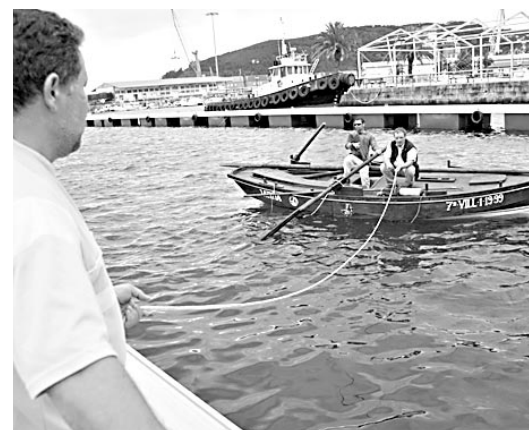
Imaxe da dorna "Jatiña", en Curuxeiras

Ó encontro chegarán barcos de tódolos puntos da Península Ibérica e das Azores. Ademais haberá representación francesa, italiana e británica. Acompañaranos autoridades. É o caso do delegado do goberno das Azores.